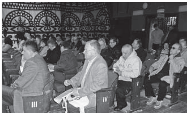
Uczestnicy inauguracyjnego spotkania w sali kina Jutrzenka

domością, że łatwiej urzędnikowi, burmistrzowi czy radnemu podejmować decyzje w imieniu mieszkańców, jeśli oni sami współtworzą je i konsultują.